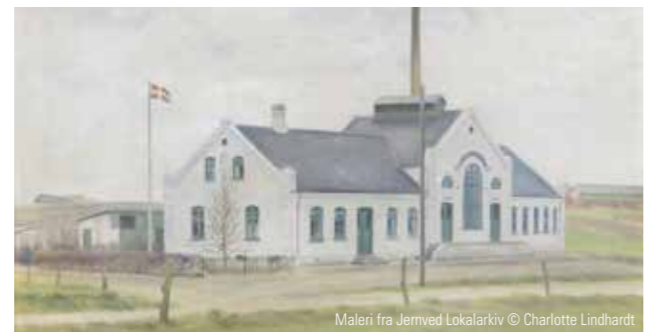
Maleri fra Jernved Lokalarkiv © Charlotte Lindhardt

Kirken ligger i Jernved sogn og blev indviet i 1925. Sidst i 1800-tallet blev Gredstedbro større end Jernved, og Gredstedbros indbyggere ønskede deres egen kirke.